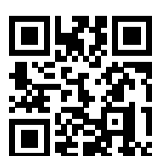
Ersatzhaltestelle Richtung Bonn