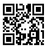
Ersatzhaltestelle Richtung Koblenz